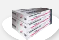
PACKAGING / MANUAL VERPACKEN & BESCHREIBUNG