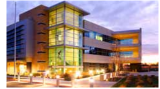
Office Ho Chi Minh City - Vietnam