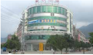
Office QingXi - China