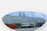
WAREHOUSE DISTRIBUTION LAGER VERTEILUNG