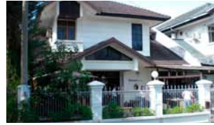
Showroom Cirebon - Indonesia