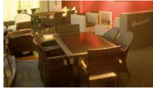
Showroom QingXi - China