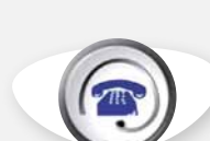
AFTER SALES SERVICE AFTER SALES SERVICE